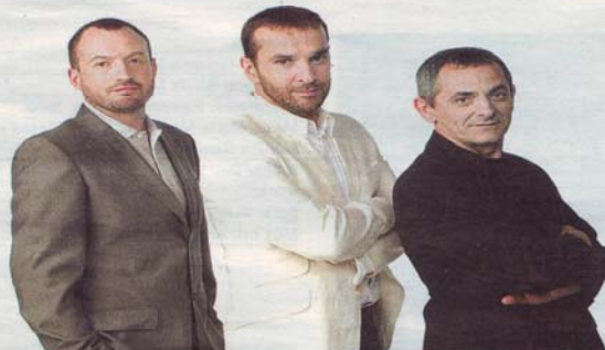
> De izda. a dcha., Alex O'Dogherty, Luis Merlo e Iñaki Miramón.